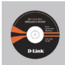
КОМПАКТ-ДИСК (мастер по быстрой установке маршрутизатора, руководство пользователя и гарантия)