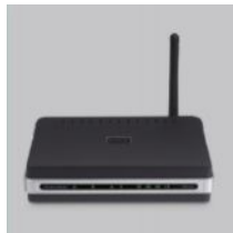
DIR-300 БЕСПРОВОДНОЙ МАРШРУТИЗАТОР 802.11G

Если что-либо из содержимого отсутствует, пожалуйста, обратитесь к поставщику.