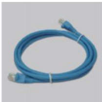
Кабель Ethernet (UTP, 5 категории)