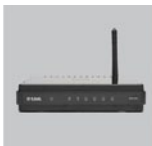
DIR-320NRU Беспроводной маршрутизатор

Если что-либо из содержимого отсутствует, пожалуйста, обратитесь к Вашему поставщику.