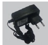
Адаптер питания 5 В постоянного тока 2 А