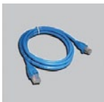
Кабель Ethernet (UTP, 5 категории)