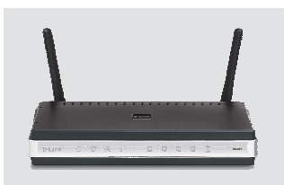
DIR-615 JUHTMEVABA N RUUTER

Kui midagi nimetatutest puudub, pöörduge edasimüüja poole.