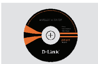
CD-ROM (Kiire paigaldusviisard ja kasutusjuhend)