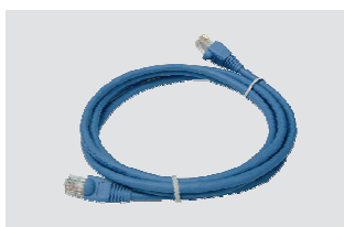
Ethernet (CAT5 UTP) kaabel