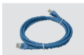
Ethernet (CAT5 UTP) kaabel