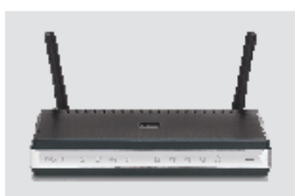
DIR-615 JUHTMEVABA N RUUTER

Kui midagi nimetatutest puudub, pöörduge edasimüüja poole.