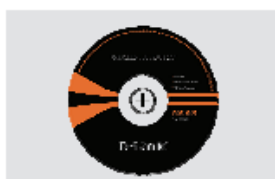
CD-ROM (Kiire paigaldusviisard ja kasutusjuhend)