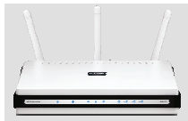
DIR-655 МАРШРУТИЗАТОР XTREME 802.11 N™

Если что-либо из содержимого отсутствует, пожалуйста, обратитесь к поставщику.