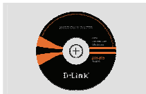
Компакт-диск (Мастер по быстрой установке маршрутизатора и руководство пользователя)