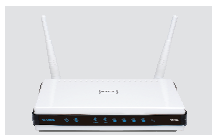
DIR-825 XTREME N™ DUAL BAND GIGABIT RUUTER

Kui midagi nimetatutest puudub, pöörduge edasimüüja poole