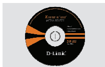
CD-ROM (Kiirpaigaldusviisard ja kasutusjuhend)