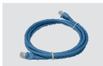
Ethernet (CAT5 UTP) kaabel