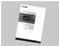
Краткое руководство по установке