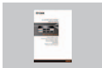
Руководство по быстрой установке