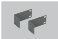
Крепежный комплект для монтажа в стойку