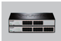
DES-1016D / DES-1024D

В комплект поставки DES-1016D / DES-1024D входит следующее: